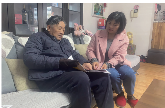
近日,台北投资公司猴嘴办事处开展“助老干部学党史”为主题的送学上门活动。探望身体状况良好的老干部10名,为其送去自制的党史学习教育材料,帮助老干部共同开展党史学习。